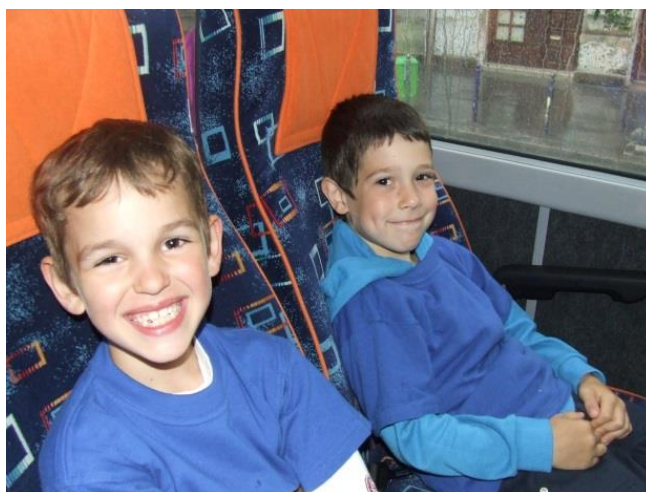
Ausflug mit dem Bus nach Budapest