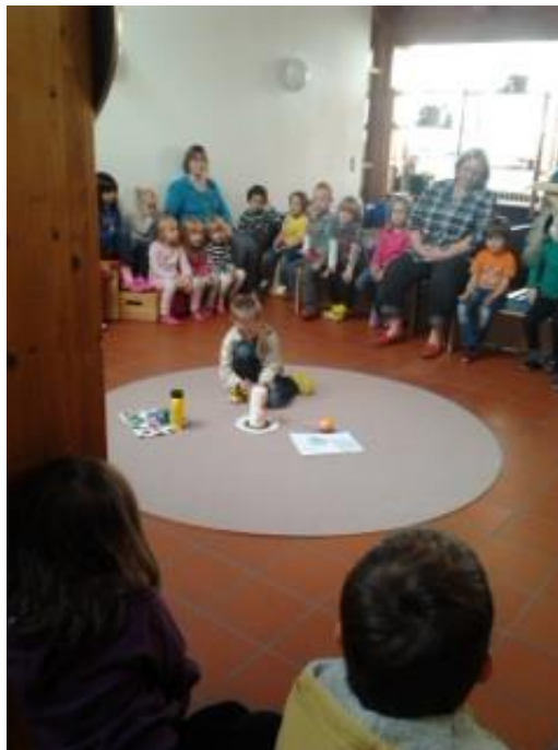
Stuhlkreis im Passau 2013