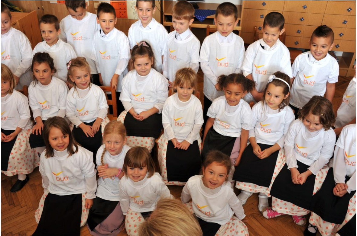
„Im Lachenland 2013“