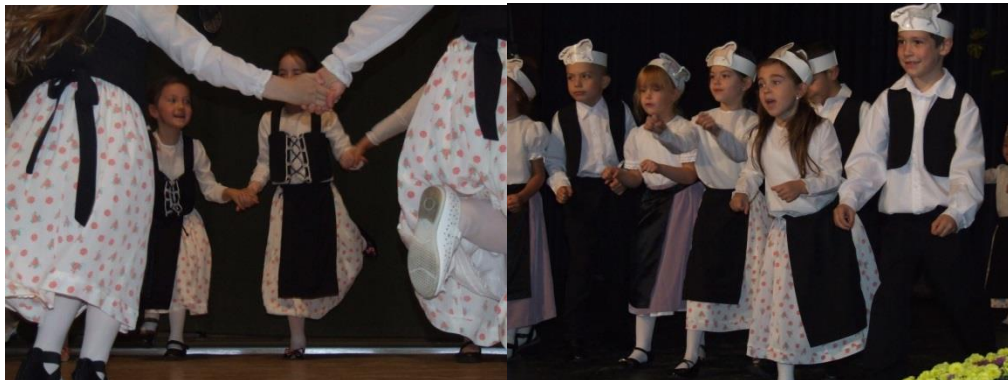
Tanz beim Kindertreff / Wetschesch 2012 und Soroksar 2013

bearbeiten, und es mit unserem pädagogischen Programm zu ergänzen. Das Leitbild bedeutet für uns eine wesentliche Grundlage.