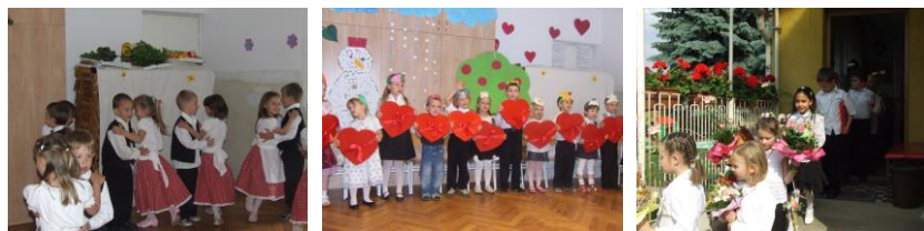
Anyák napi táncok