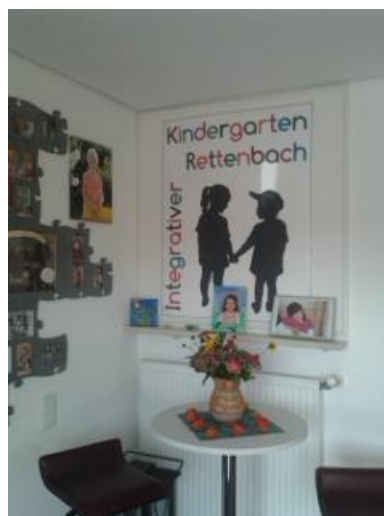
Hospitation im Kindergarten Rettenbach 2013