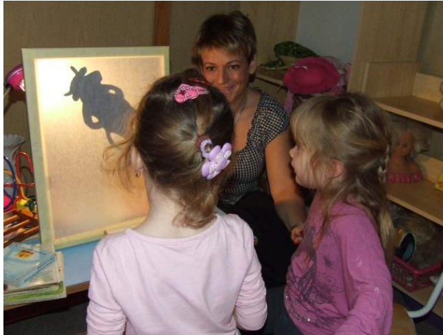
Das Schattenspiel mit den Haustieren