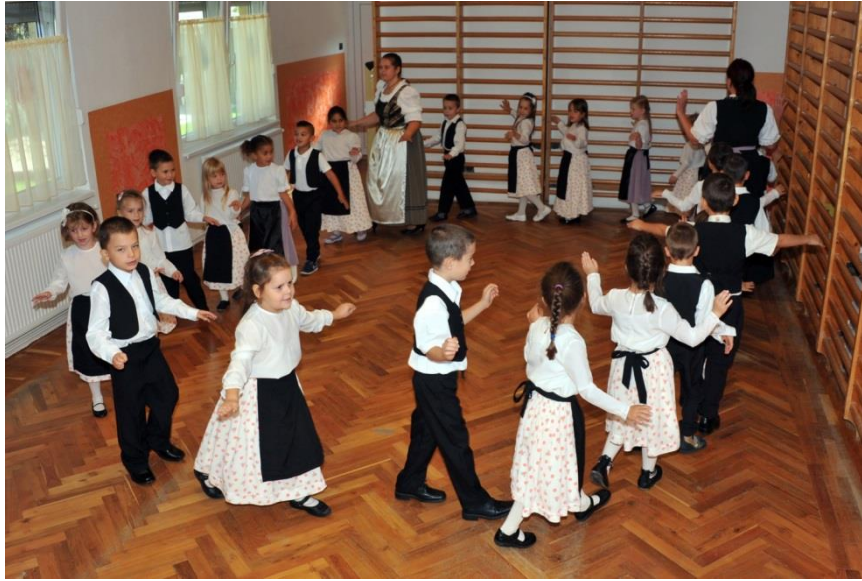
„Summ, summ, summ Bienchen summ herum“