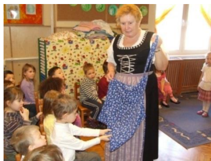
Unsere frühere Stellvertreterin Frau Inancsi, die uns immer wieder besucht