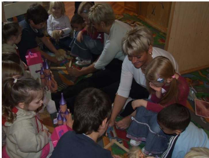
Wir dramatisieren zusammen unser Lieblingsmärchen: Froschkönig