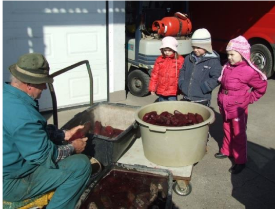
Bei einer Sauerkrautherstellerfirma